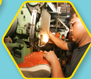
CUERO Máquinas de curtido, reparación de calzados