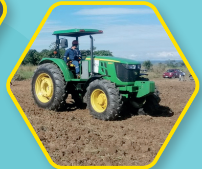
AGRÍCOLA Arados, trailas, incubadoras, fumigadoras