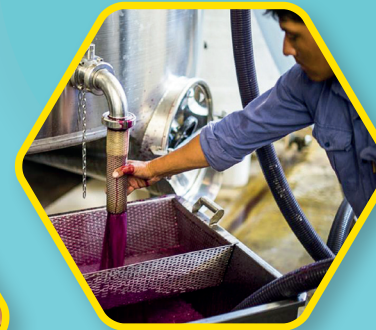
VITIVINÍCOLA Máquinas para la producción de vino