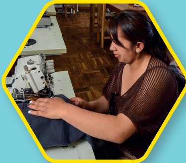
TEXTIL Máquinas de coser, de tricotar