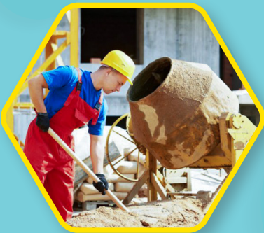
CONSTRUCCIÓN Y MINERÍA Topadoras, niveladoras