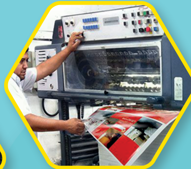
GRÁFICO Máquinas para imprimir