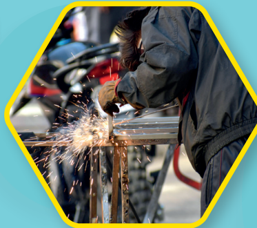
METAL MECÁNICA Máquinas para soldar